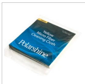
Žlutá čisticí utěrka z mikrovlákna