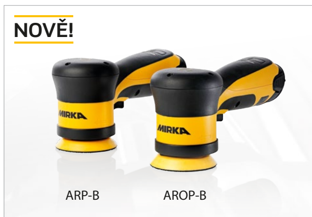
Leštičky Mirka® ARP-B a AROP-B