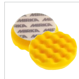
Molitanový kotouč Mirka