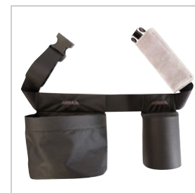
Víceúčelový pás Mirka