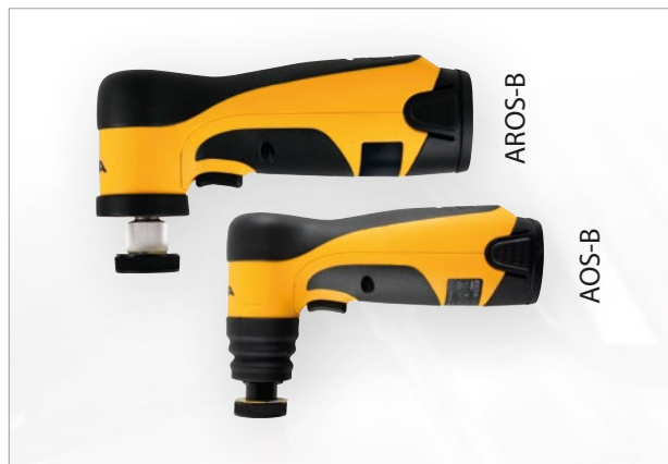
Brusky Mirka® AOS-B a AROS-B