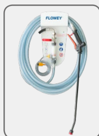
60400 Acid spray system