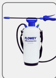
50054-10C Sprayer 10L