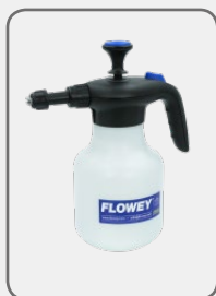
61016 Jet foamer 1,5l